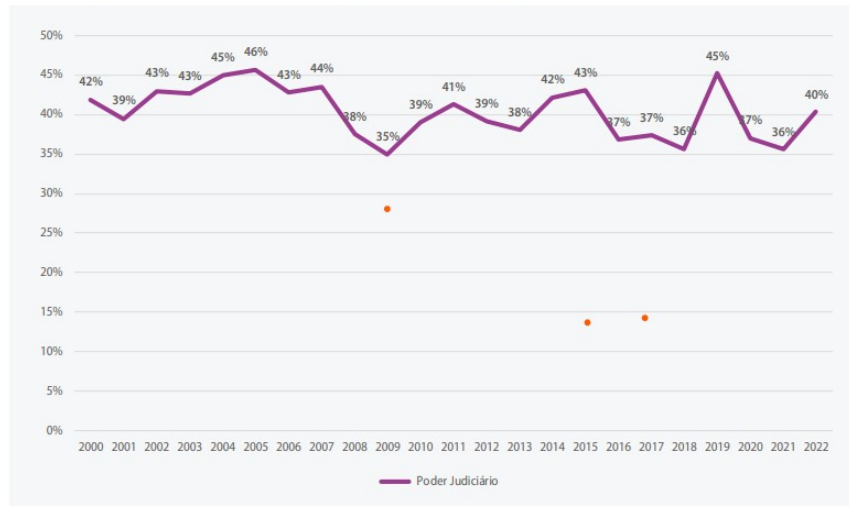
Figura 1 – Percentual de Ingressantes Magistradas no Poder Judiciário